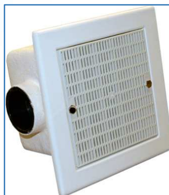
Modelo Plástico blanco / White plastic model