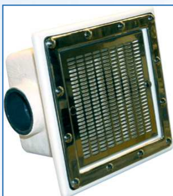
Modelo Inox AISI 304 / Stainless steel AISI 304 model